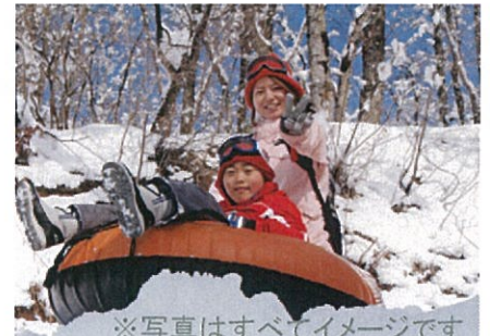
※写真はすべてイメージです